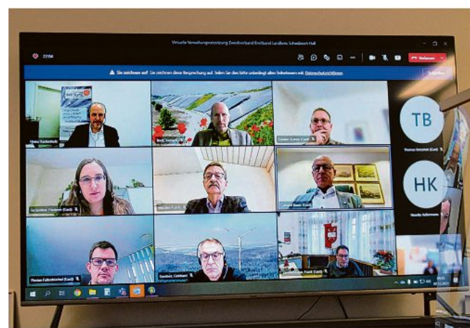
Die Mitglieder waren online zugeschaltet.